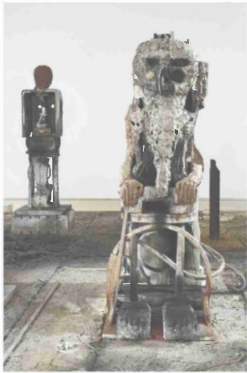
הומא באבא, "...ובמרוצת מאה אלף שנים, מלב העפר, בצבצה שוב התקווה, כעלווה", 2007

מצער שגופי אמנות חדשים הקמים כעת, במיוחד ללא כוונת רווח, אינם מחזקים דווקא מגמה של אמנות נגישה לכל. הדגם של תרומה מומלצת, שמנהיגים מוסדות ציבוריים ופרטיים רבים בחו"ל, טרם השתרש בישראל