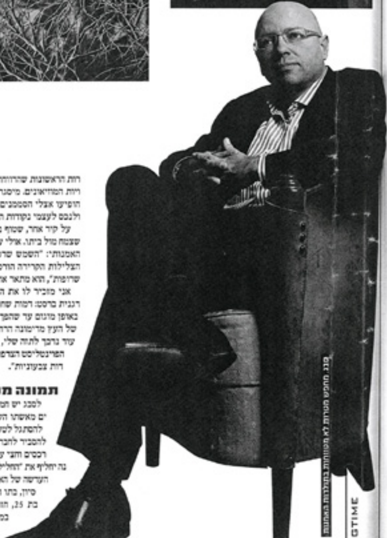
סגן תומך מטרות לא ממוחזרות בתרבות האמנות

רוח הראשונה שהרוונה תוצאתי על קניית רפרודוקציות יקרות בחיי ריות המדיאונים. מיסטרית תלתית אתן ברירות הראשונות שלי. כמה הופיעו אצלי הסמנים הראשונים של אספנות. היה כי הריצון לצבור ולנסס לעצמי נקודות תרבות."